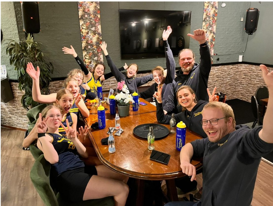
Nagenieten in de kantine